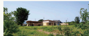
のどかな自然が広がるロケーションは開放感いっぱい♪