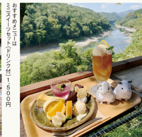
おすすめメニューはミニスイーツセット(ドリンク付) 1,500円