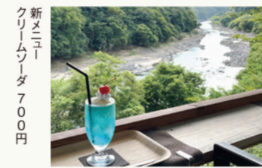
新メニュー クリームソーダ 700円

自然の中で、さわやかな秋の風を感じてリフレッシュ☆雄大な琵琶湖が見渡せるカフェや緑いっぱいの景色に囲まれたレストランなど、一度は訪れてみたいおいしさと絶景を一緒に味わえるスポットを厳選してご紹介♪