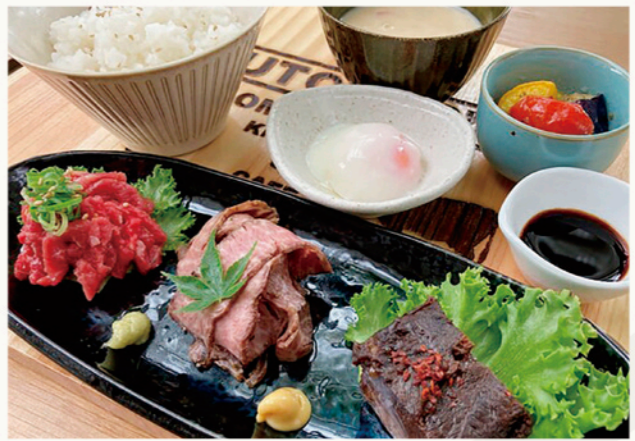
BUTCHER'S近江牛3種盛 2,250円(税込)